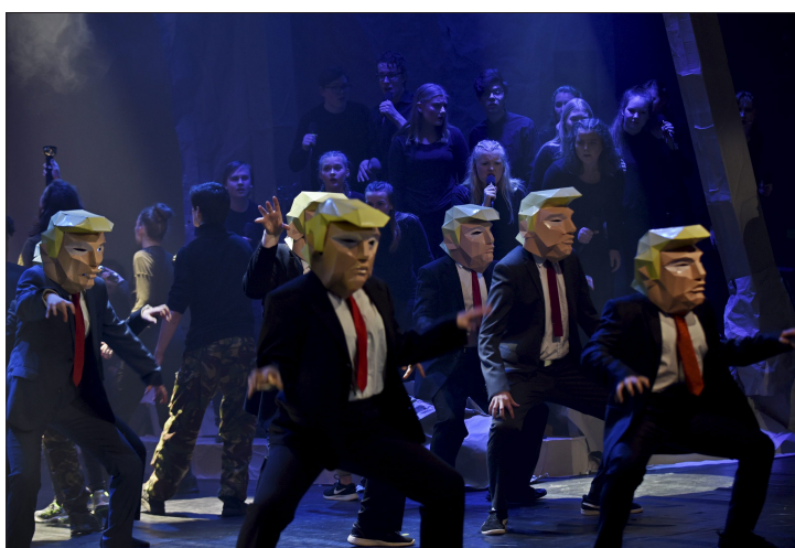
HALVE TRUMP-GJENGEN: Musikk frå filmen «Ghostbusters».