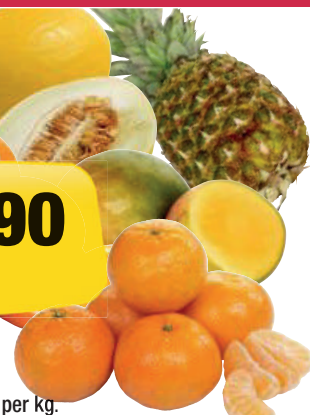
Gjeld veke 8. Med atterhald om utseid og trykkfeil.

Stryn 7-23 Volda 8-22 (20) Fosnavåg 7-23 Hareid 7-23 (8-21)